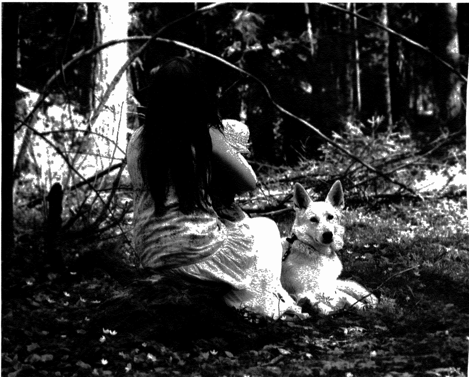
Sandra, som egentligen heter något annat, vill vara anonym. Hon har ingen kontakt med Hare Krishna-rörelsen i dag, och vill inte heller ha det. Men hon hoppas att hon med sin berättelse i boken "Sektbarn" kan öppna myndigheternas ögon för vad som hände då, och för hur barn kan ha det i olika sekter även i dag.